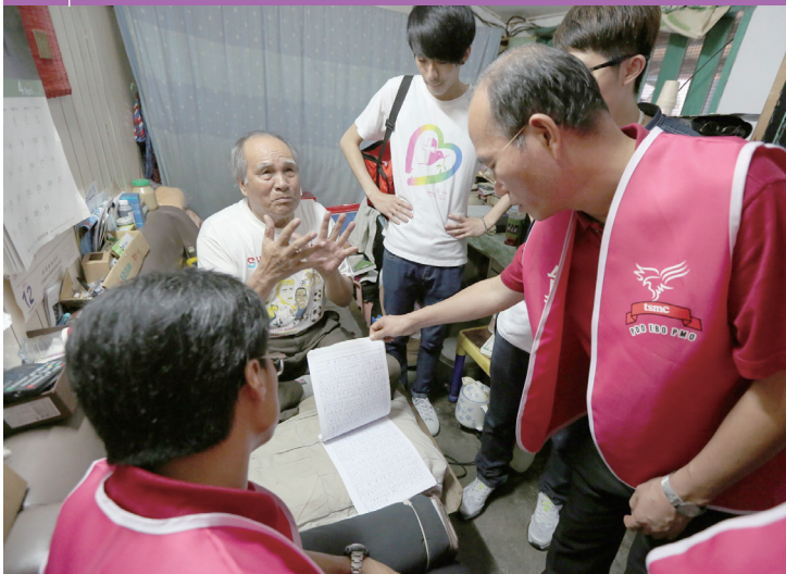
台積電志工社捐贈兩台全新恆溫送餐車，讓門諾基金會的送餐服務不間斷。台積電志工們也跟著送餐服務員一起到長輩家中關懷訪視，家裡許久沒這麼熱鬧的伯伯不禁熱淚盈眶。

門諾基金會注重對個案多樣化個別化的服務與發展，送餐的便當可分為中央廚房製餐與社區製餐點兩種，依個案需求提供菜切飲食、半流質飲食、治療飲食、普遍飲食、軟質飲食、健康飲食、素食等等。在服務過程中也相當注重每位被服務者的心態，發掘個