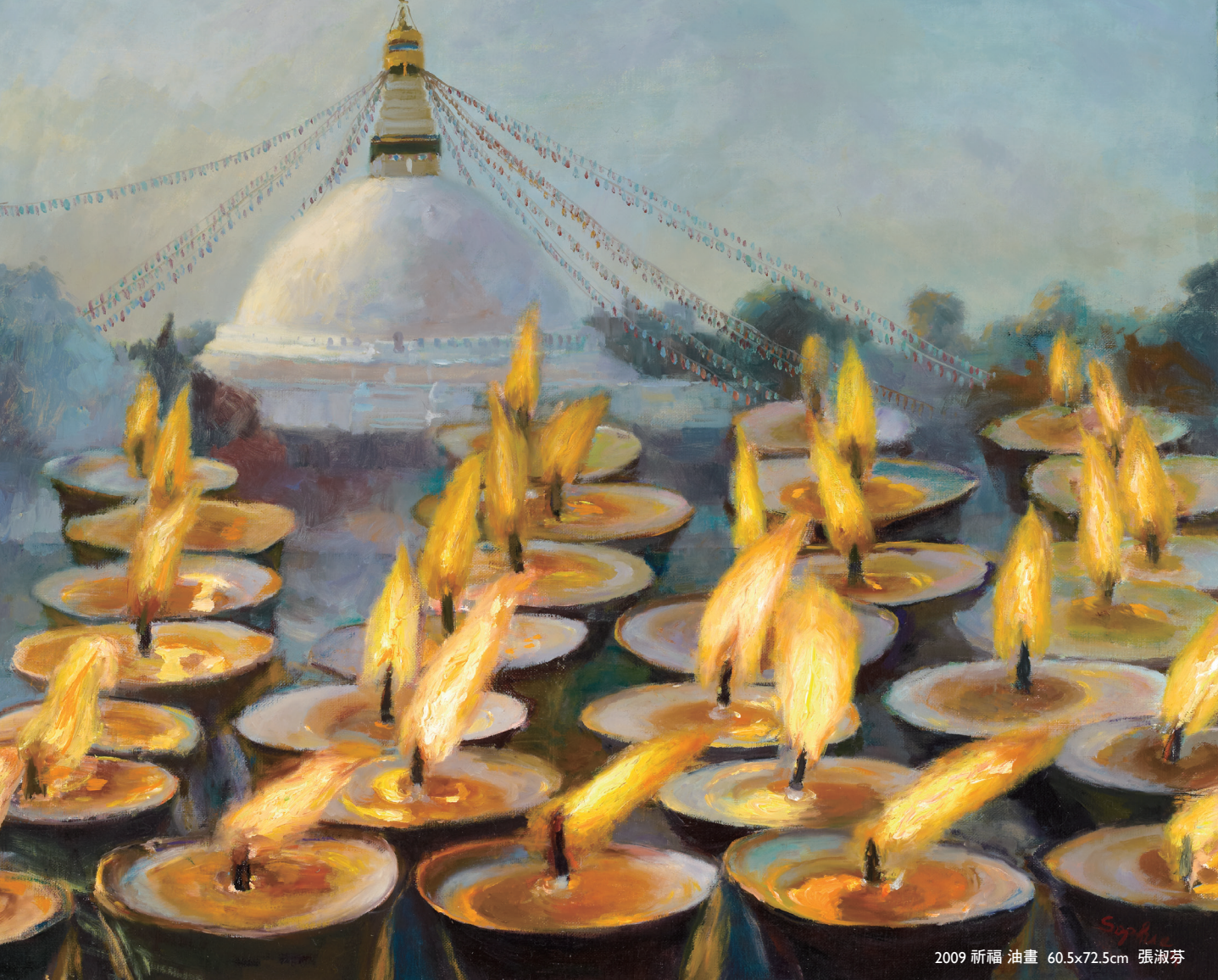
2009 祈福 油畫 60.5x72.5cm 張淑芬

點上一盞燈，我祈請諸佛菩薩， 護佑我的親人，身體健康心地光明， 讓他們能以自身慈悲慧心作燈盞， 為世間點燈增光亮。