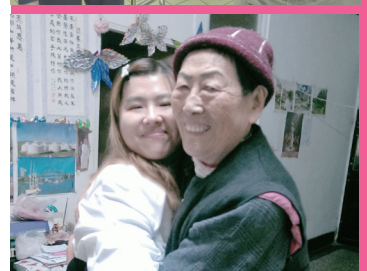
中國醫藥大學附設醫院老醫科團隊，都會隨著志工一同前往獨居長輩家中訪視，醫師與管理師替長者看診、評估整體健康狀況，付出真心、視病如親。